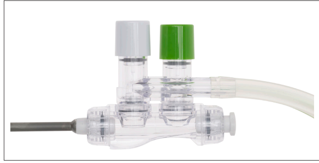
Suge- og skyllesæt - håndstykke